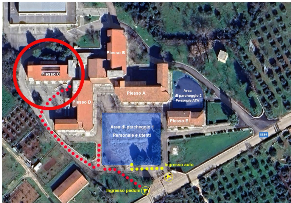
Figura 1 – Ubicazione del Plesso C a San Nicandro Garganico, via Marconi, SS 89